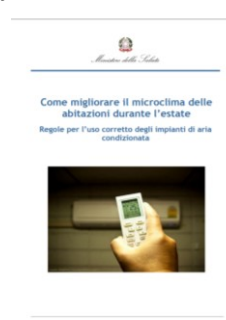
Come migliorare il microclima nelle abitazioni durante l'estate