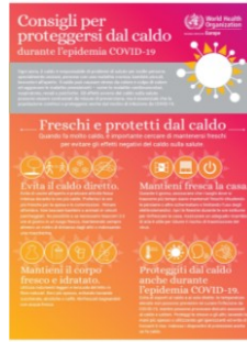
Consigli per proteggersi dal caldo durante l'epidemia covid-19