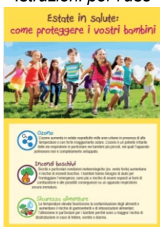
Come proteggere i vostri bambini