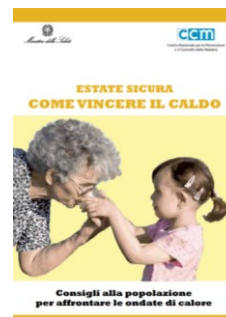
Consigli alla popolazione per affrontare le ondate di calore