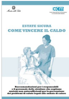
Raccomandazioni per i responsabili e il personale delle strutture