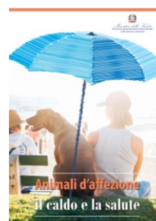
Animali di affezione