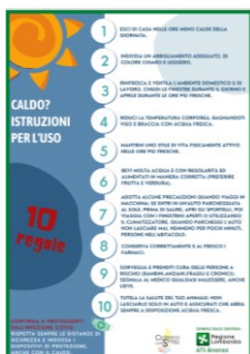
Caldo? Istruzioni per l'uso

Sul sito del Ministero della salute, sono inoltre riportati opuscoli sia di carattere generale (consigli per proteggersi dal caldo), sia di carattere specifico (es. cura degli animali di affezione, viaggiare sicuri ecc.). Gli opuscoli, che saranno messi a disposizione sulla pagina informativa del sito di ATS Brianza, sono: