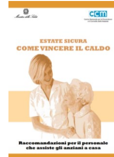
Raccomandazioni per il personale che assiste gli anziani a casa