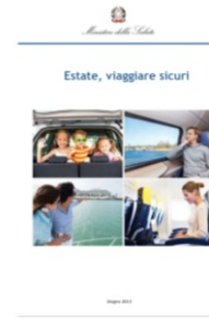
Estate: viaggiare sicuri