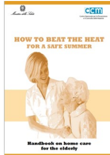
Handbook on home care for the elderly