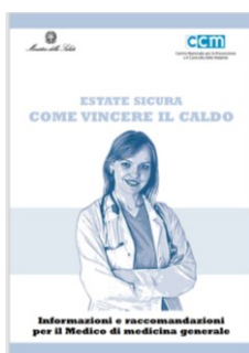
Informazioni e raccomandazioni per il Medico di medicina generale