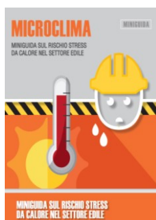
Rischio Stress da calore nel settore edile