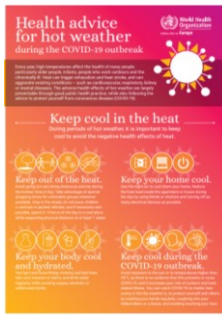
Health advice for hot weather during the COVID-19 outbreak