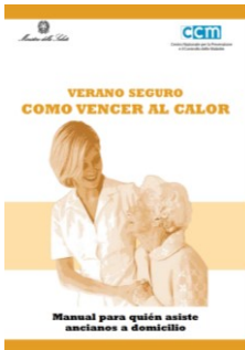
Manual para quién asiste ancianos a domicilio