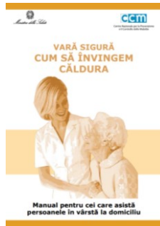
Manual pentru cei care asistă persoanele în vârstă la domiciliu